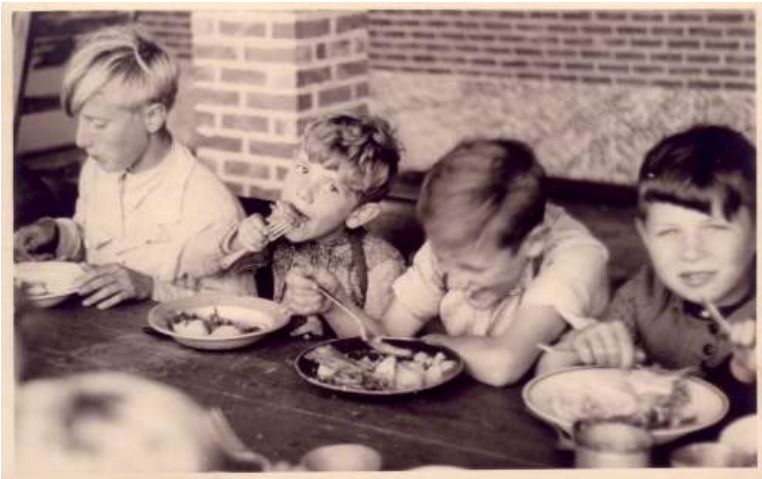
Tafelmanieren, 1945 - 1949