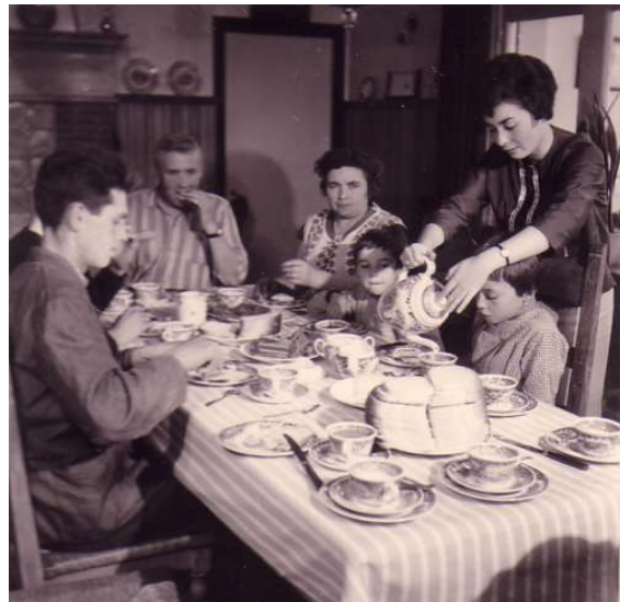
Aan tafel in de jaren '60